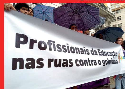
Faixa do Sepe, na escadaria da Câmara dos Vereadores.

No dia 9 de janeiro, milhares de manifestantes lotaram a Cinelândia, no Ato em Defesa da Democracia. Nem a chuva intermitente impediu o protesto contra a tentativa de golpe do dia 8 de janeiro, em Brasília, quando bolsonaristas depredaram o Palácio do Planalto, o Congresso e o STF. Ato similares, exigindo o fim da violência e não concessão de anistia aos envolvidos ocorreram em todo o País. No Rio, os manifestantes reafirmaram que não irão aceitar golpes contra o sistema democrático e as eleições de 2022, que elegeram Lula presidente. E exigiram a responsabilização do ex-presidente Jair Bolsonaro e de todos os políticos e empresários que apoiam e financiam atos antidemocráticos.