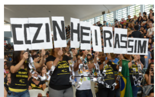
SAMUEL TOSTA/ARQUIVO SEPE

Fonte: Prefeitura da Cidade do Rio de Janeiro. Elaboração: DIEESE. Subseção SEPE-RJ.