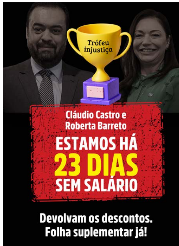
Campanha do Sepe nas redes sociais denunciou descontos arbitrários na rede estadual na folha de agosto

O Estado se comprometeu, no prazo de 100 dias, a encaminhar ao Conselho do Regime de Recuperação Fiscal uma proposta de migração com aumento da carga horária de 18h para 30h aula/semanais. Não temos resposta sobre esse item.