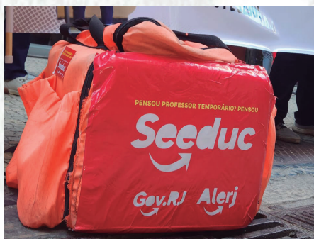
Ato na Alerj, contra o Projeto de Lei aprovado

Cláudio Castro, com apoio da ampla maioria da Alerj, aprovou às pressas um projeto que permite a contratação de cerca de 15 mil professores temporários , o equivalente a 30% do total de docentes da rede. Em vez de concurso (o último foi há 10 anos), o governo aposta em mais trabalho precário. O Sepe entrou na Justiça e, nesta campanha, luta pela revogação da Lei 10.363 , convocação dos aprovados e por novo concurso.