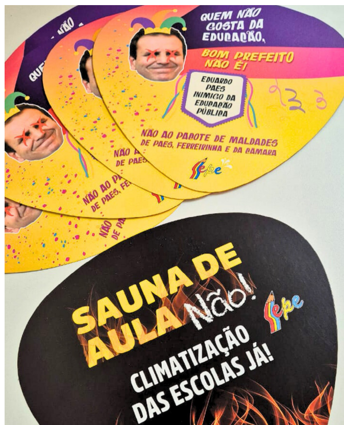
Leque distribuído pelo Sepe no carnaval e nas escolas

O levantamento, até 21/2, teve 150 escolas citadas com problemas de climatização na rede municipal do Rio, número 10 vezes superior ao divulgado pelo prefeito. O sindicato requisitou audiência com a SME para discutir a situação das escolas, mas não teve resposta. Além disso, o Sepe vem recebendo vídeos e áudios de escolas, em especial de merendeiras, que denunciavam a sensação térmica absurda nas cozinhas. ■