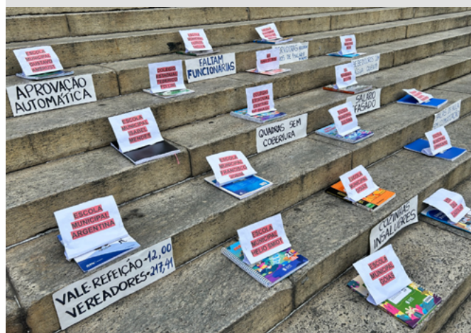
Ato nas escadarias da Câmara Municipal, em 05 de maio

Os profissionais de educação da rede pública municipal do Rio de Janeiro farão assembleia geral híbrida no dia 16 de maio (sábado), às 10h, com a parte presencial realizada no auditório do Sepe (Rua Evaristo da Veiga 55 – 7º andar). De acordo com o Dieese, o reajuste necessário em 1º de janeiro de 2026 para recompor as perdas salariais da rede municipal de 2019 para cá teria que ser de 24,07% pelo IPCA ou 23,88% pelo INPC. Isso, sem falar no vale alimentação, congelado em R$ 12 desde o dia em que foi criado, há 14 anos.